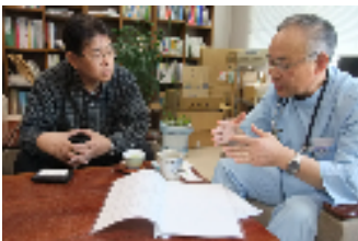
緑の里クリニック院長から被災直後からの透析医療対応を伺う。被災しながら泊り込みで従事した医療スタッフの話から透析患者への苦言を含め大変参考に。

釜石市の小学校の避難所には42名の透析患者が避難生活をしています。食事は一般被災者と同じなので「朝食べて、昼夜は食べない」(一般食は『塩分』『カリウム』などが多く透析患者が大量に食べると心臓発作などを発病：すでに塩釜市の避難所で高カリウム血症により塩釜市2名が死亡)。「足が悪いので1回しかお風呂に入っていない」「洗濯ができない」等、透析患者にとって「食事=治療」である筈が避難所では出来ない状況。一日も早く仮設住宅等に入居して、透析食を食べられるようになれば、折角、大災害で救われた命が再度危険に晒されています。今後の支援の在り方が重要になります。