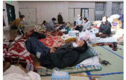
避難所体育館の一角に「透析患者」が集められ避難している。男女の別仕切りもありません。

そして、食糧支援やガソリン確保などの緊急支援から生活再建支援へとニーズが変化。沿岸部の津波被災地を除けば急ピッチに復旧が進む中、家や車を失った透析患者が置き去られかねない状況下であり、早急な支援対策が求められています。