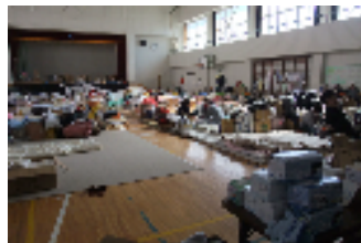
釜石市の避難所の全景。避難所により大きな格差が。テレビが朝・夕の1-2時間しか見れず、お年寄りなどは動くことなく布団に横になる方が多かった。