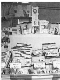
エコ・ライス新商品のアルファ化米