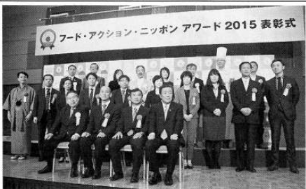
各部門の受賞者代表が主催者代表・来賓とともに記念撮影