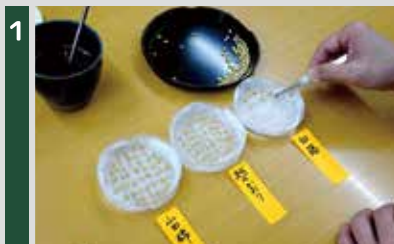
1 水を含ませたろ紙の上に種もみを品種ごとに丁寧に並べる。

今年の米づくりに向けて、種もみの発芽実験を行いました。種もみは自家採取を繰り返すと「種がボケる(種が劣化し発芽率・品質が低下する現象)」可能性が高いので、種の専門店から購入するのが一般的ですが、今回実験した3種類は昨年生産者において自家採取してもらったもの。3品種共に90%以上の発芽率で、今年度の米づくりもスムーズに始められそうです！