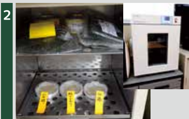
2 保温庫を30度に設定し、乾燥しないように気をつけながら保温。